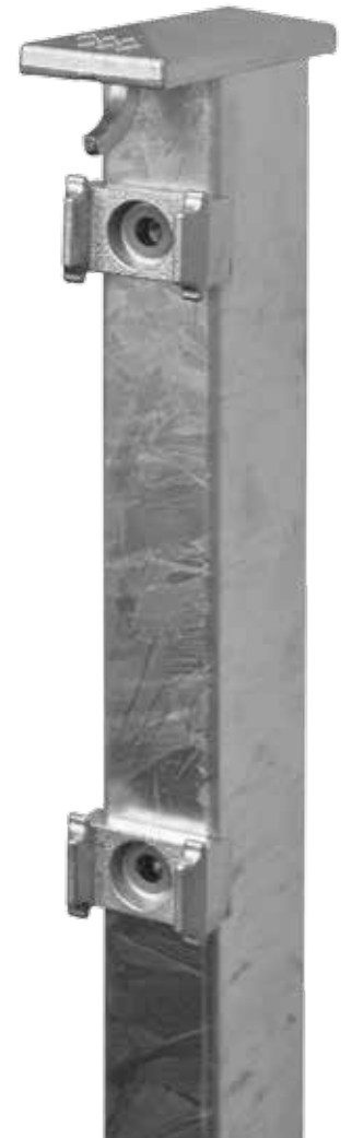
Der Zaunpfahl komplett aus Metall