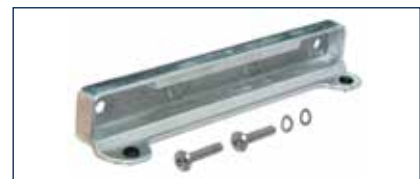
Der passgenaue Anschlag sorgt für höchste Schließgenauigkeit