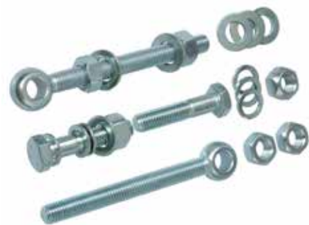
Sehr stabile Torbänder mit Augenschrauben versehen das Multi-Tor auf