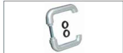
Die neue hochwertige Alu-Drückergarnitur passt optisch perfekt zum Multi-Tor