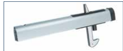
Der Torflügelfeststeller* für das Multi-Tor stammt vom Industrie-Tor