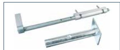
Auch Bodenriegel und -hülse* werden jetzt in Industrie-Qualität geliefert